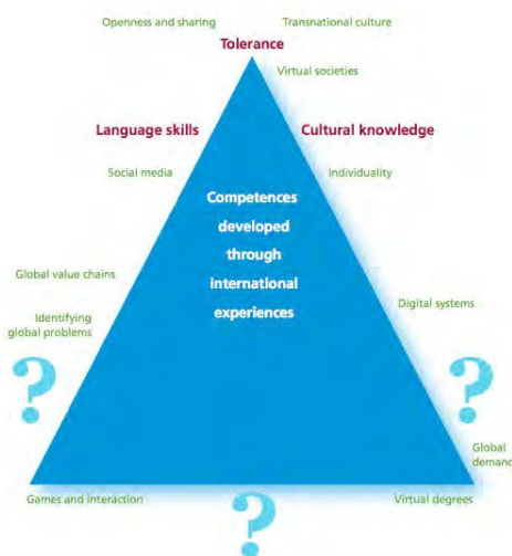
Figura 1. Known and hidden competences.

Con respecto a los aspectos de la movilidad internacional, la gran mayoría de las IES en Europa (69% a 71%) envió y recibió un número reducido de estudiantes (menos de 100) al año. Esto está en consonancia con las observaciones en los datos estadísticos Erasmus.